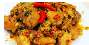
POULET SAUTÉ + 1 accompagnement 10 000 F CFA