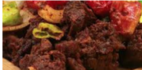
CHOUKOUYA D'AGOUTI Attiéké 8 000 F CFA