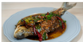
poisson braisé Carpe + 2 accompagnements 10 000 F CFA 12 000 F CFA 15 000 F CFA