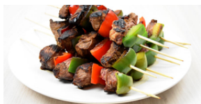
BROCHETTES DE FILET DE BOEUF 2000 F CFA