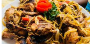
CHOUKOUYA DE LAPIN + Attiéké 6 000 F CFA