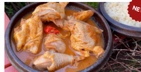
SOUPE DE PINTADE 15 000 F CFA