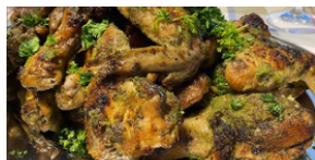
Poulet braisé +2 accompagnements 10 000 F CFA