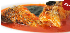
SOUPE DE POISSON 10 000 F CFA