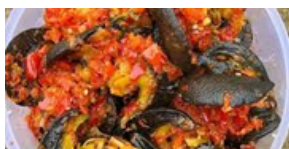
ESCARGOTS SAUTÉS +1 accompagnements 9 000 F CFA