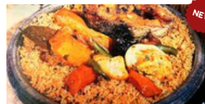
TCHEP POISSON OU POULET (Riz+Legumes)