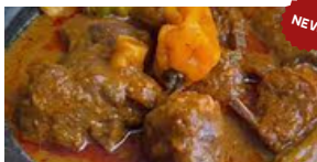
SAUCE GRAINE (Graine de palm+ gibier+ pattes de boeuf)