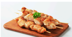
BROHETTE DE POULET 2 000 F CFA