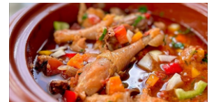
SOUPE DE POULET 10 000 F