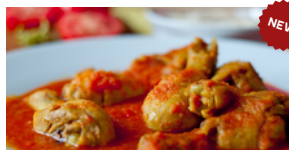
SOUPE DE PONDEUSE 15 000 F CFA