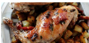
LAPIN SAUTÉ ENTIER + 2 accompagnements 15 000/ 20 000 F CFA