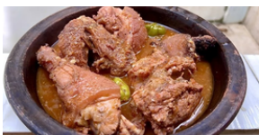
SOUPE DE CABRI 6 000 F CFA