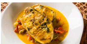
POISSON À L'ÉTUVÉE Poisson cuit dans son jus