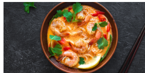
SOUPE DU PÊCHEUR 15 000 F CFA