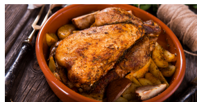
LAPIN BRAISÉ + 2 accompagnements 10 000 F CFA 20 000 F CFA