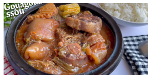
SAUCE GOUAGOUASSOU (Gombo+aubergine+Gnagnan+Gibier+Pattes de boeuf)