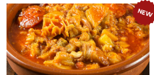
SOUPE DE TRIPES 5 000 F CFA